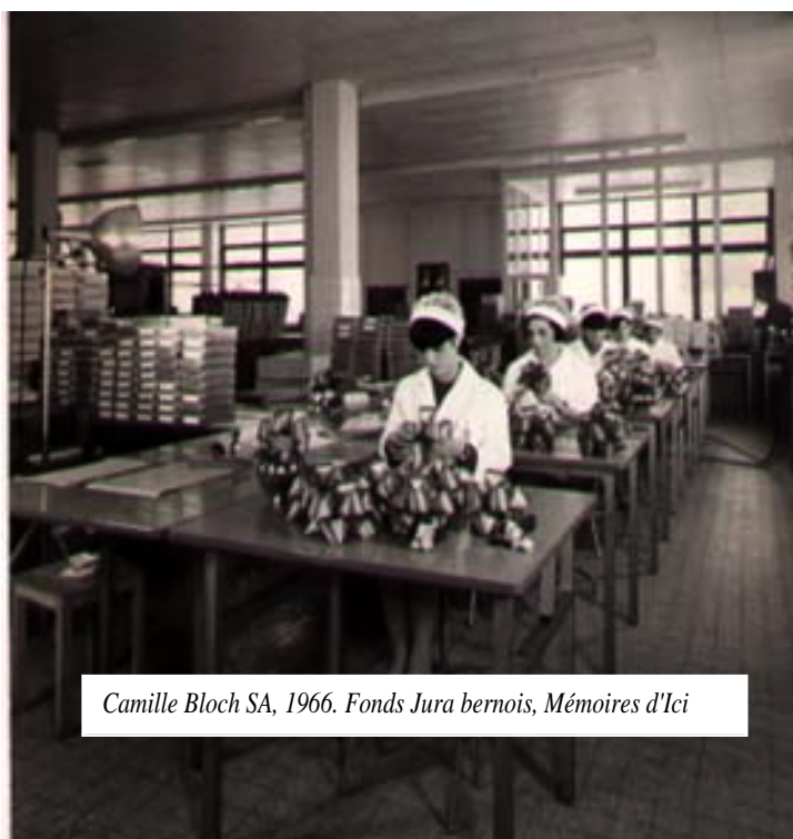
Camille Bloch SA, 1966.

Ce fonds complète la collection du Jura bernois qui était déjà consultable à Mémoires d'Ici. Il