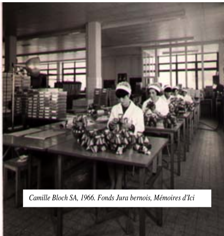
Camille Bloch SA, 1966.

Ce fonds complète la collection du Jura bernois qui était déjà consultable à Mémoires d'Ici. Il