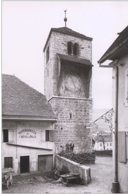
La tour Saint-Martin, depuis le nord

A Saint-Imier, le nom de la reine Berthe est aujourd'hui encore associé à une tour : la tour Saint-Martin, dite aussi tour de la reine Berthe.