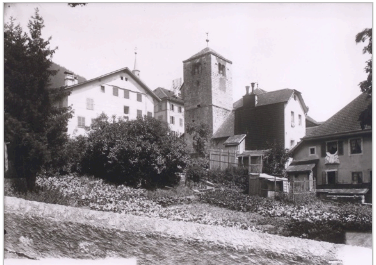
La tour Saint-Martin, depuis le sud

L'église Saint-Martin, qui fut précédée par deux autres bâtiments, fut construite au XIV e ou du début du XV e s. La tour fut érigée plus tard, entre la fin du XV e et le début du XVI e s. Il apparaît de manière évidente qu'elle ne peut en aucun cas être attribuée à la reine Berthe, morte quelque 500 ans auparavant! Selon les archéologues, le fait que la tour paraisse plus ancienne qu'elle ne l'est, avec son style roman archaïsant, pourrait en partie expliquer qu'on l'ait associée à la reine.