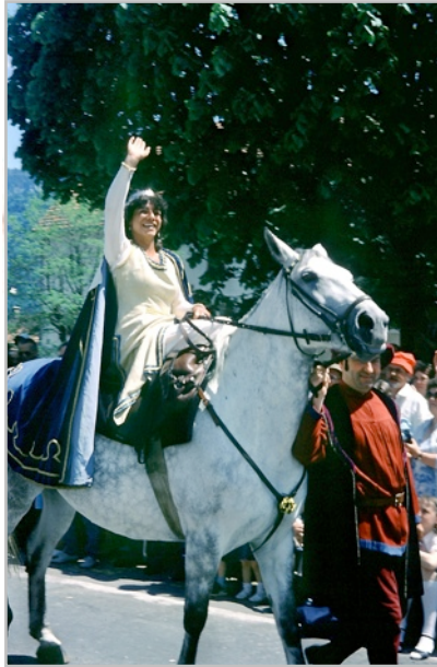
La reine Berthe (Mémoires d'Ici)

En 1984, Saint-Imier fêtait son 1100e anniversaire. Parmi les manifestations commémoratives, le cortège du mois de juin fut très apprécié. On y vit défiler une reine Berthe venue à cheval de Payerne, avec tout un groupe folklorique en costumes.