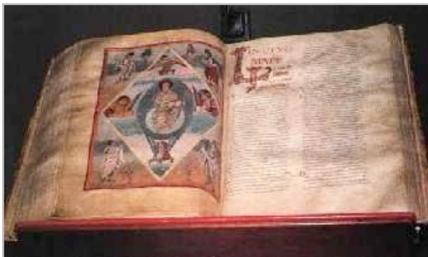
La célèbre Bible de Moutier-Grandval (British Museum)

Après la mort de Rodolphe III, petit-fils de la reine Berthe, le second royaume de Bourgogne, est rattaché au Saint Empire romain germanique. Rodolphe, sans héritier mâle, prépare ce rattachement de son vivant avec l'empereur Henri II, son cousin.