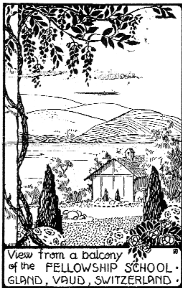
Carte postale de la Fellowship School, à Gland. Archives de la Ligue internationale des femmes pour la paix et la liberté (microfilms), Palais des Nations, Genève