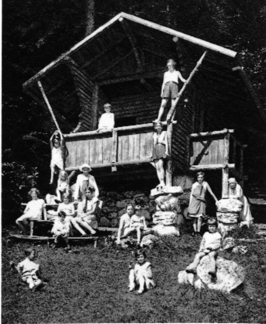
Kindergruppe im Waldhüeli